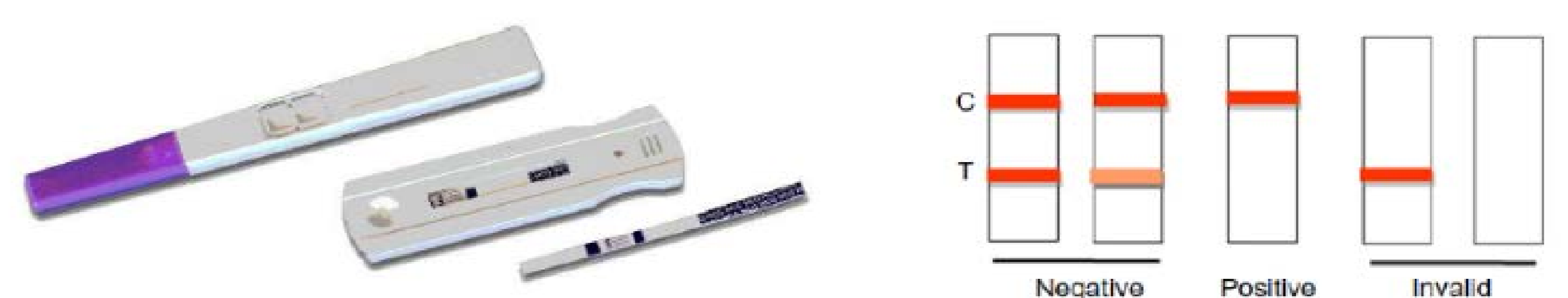
Figuur 2. Een mogelijke uitvoeringsvorm van de biosensoren.

De biosensoren zijn gebaseerd op de "Lateral Flow Technology". Hierbij moet een druppel van de bemonsterde vloeistof op een papieren strip in de sensorbehuizing aangebracht worden. Een streepje geeft aan of de sensor goed gewerkt heeft en het andere streepje of de concentratie van de specifieke stof boven de drempelwaarde ligt.